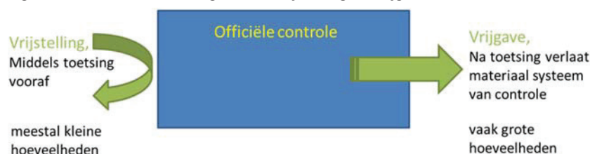
Figuur 3. Schematische weergave van vrijstelling en vrijgave van het controlestelsel

Een belangrijk begrip bij de begrenzing van het controlestelsel is de «niet-verwaarloosbare blootstelling». Dit begrip wordt op diverse plaatsen in de richtlijn toegepast en is daarin uitgewerkt in Bijlage VII, onderdeel 3. De inhoud van deze bijlage is als bijlage 3 bij het besluit opgenomen.